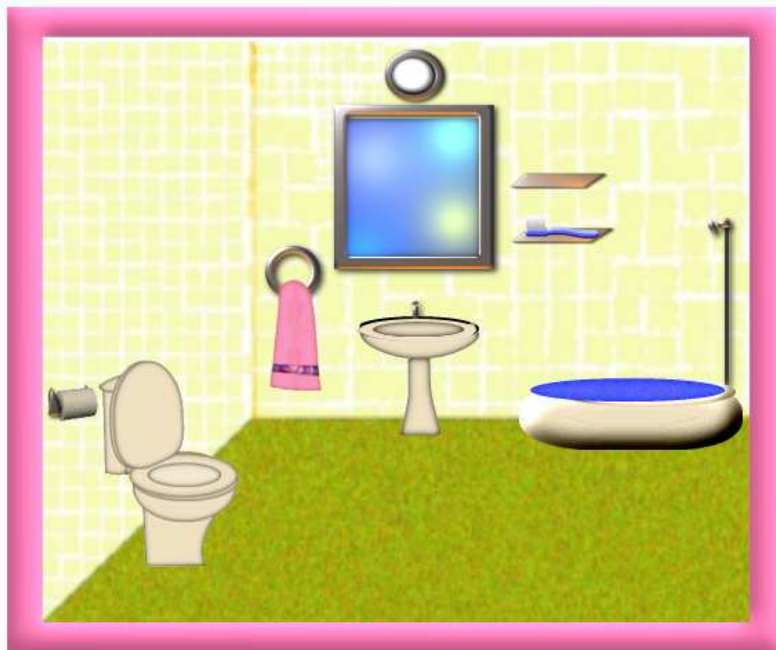
el cuarto de baño